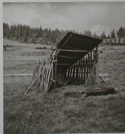
Prístrešok pre pastiera oviec v Osturni