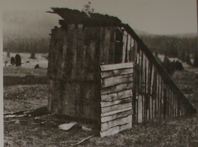
Kolibka pre ovčiarov na nočné strázenie oviec na salaši v Liptovskej Osade

Potrebám pravidelného premiestňovania košiarnej ohrady sa prispôbovala aj jej konštrukcia. Skladala sa z ľahkých prenosných a ľahko montovateľných dielov, pre ktoré sa všeobecne zaužívalo pomenovanie lesa , lesica , ale aj bránka (dolný Liptov). Ich staršiu formu možno opísať ako konštrukciu pozostávajúcu zo žrdky dlhej 3-4 m, do ktorej boli do vyvrtaných otvorov vsadené vertikálne priečky šteblíky .