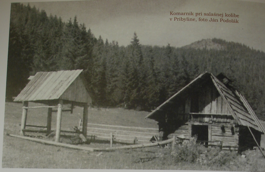
Komarník pri salašnej kolibe v Pribyline

Na predku spávali všetci pastieri. Nohy mali obrátené do ohňa. Dlážka koliby bola pokrytá ľubmi, aby sa ľuby nezahýbali, boli poprihýbané drevenými klincami. Klince – kliny boli robené z halúz. Spávalo sa v nohaviciach, tak ako boli oblečení celý deň. Pod hlavou mal čičinu a kabát. Ak bola zima, ešte sa prikryli halienu. Ukonaným valachom a honeľníkom veru nebolo tvrdo, spali ako zarezaní, ležali ako drevo. Najčulejšie spával bača a ročitý valach, lebo im najviac záležalo na všetkom.