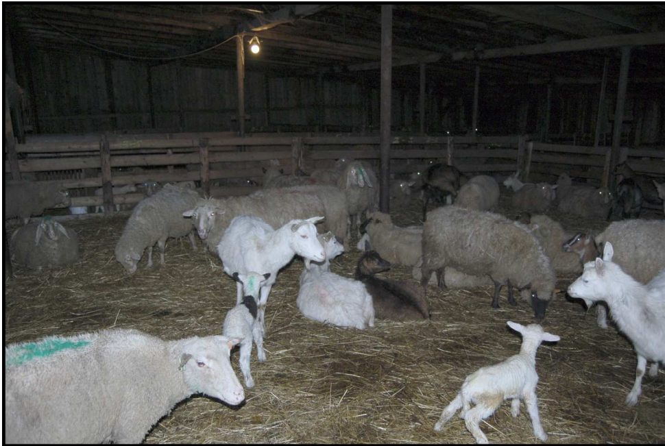
13. Bahnění ovcí v ovčíně (u chovatele J. Kocurka)