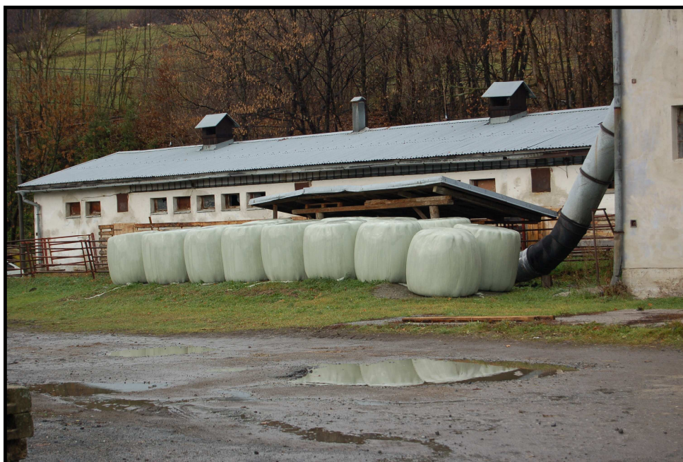
24. Senáž ve fóliích uskladněná pro zimní výkrm (u chovatele J. Václavíka)