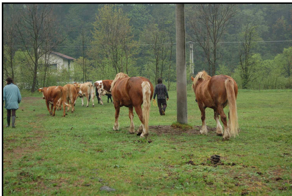
22. Koně a krávy na společné celoroční venkovní pastvě (u chovatele J. Kocurka)