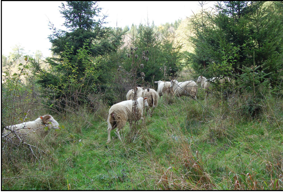
9. Horská pastvina (u chovatele J. Bubely)