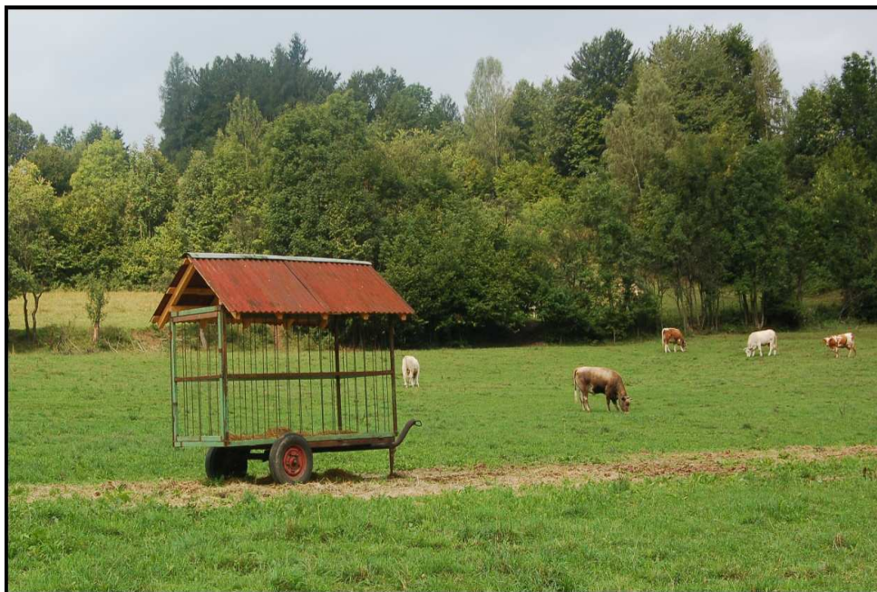
17. Krávy na pastvině s pojízdným přístřeškem na suchou píci (u chovatele J. Šuláka)