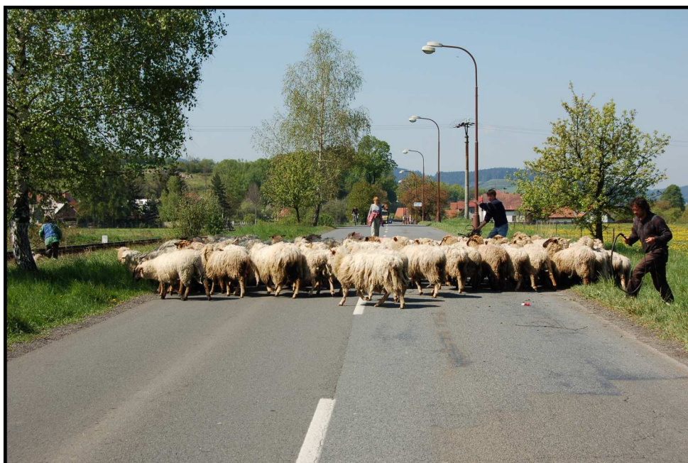
2. Výhon ovcí z údolních pastvin na hřeben Javorníků (u chovatele J. Kocurka)